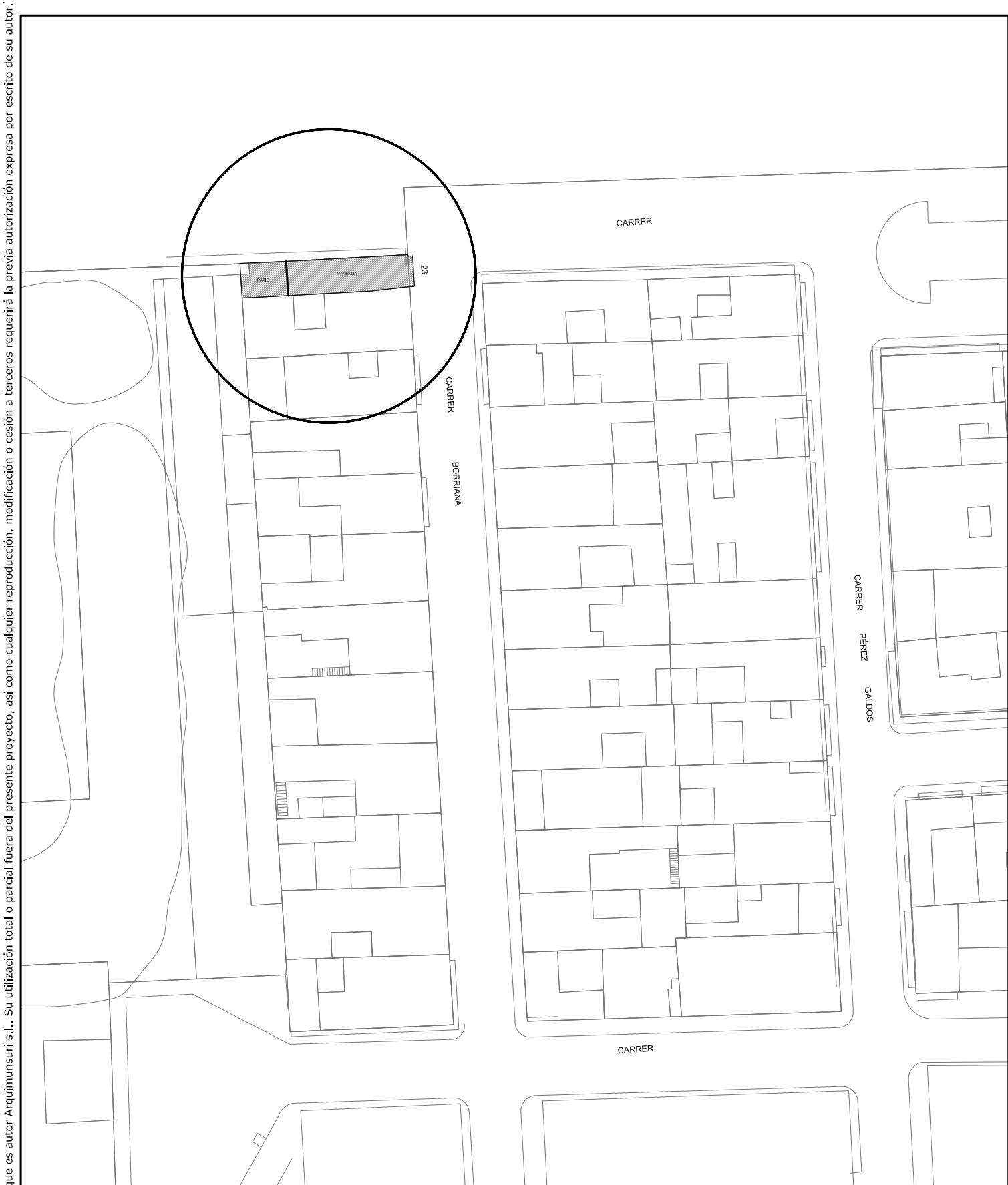
Situación E: 1/500